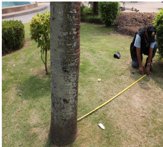
ภาพที่ ๕ ทรงพุ่ม ๓.๖ เมตร