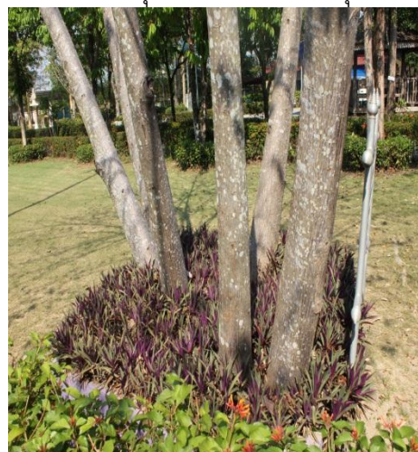
ภาพที่ ๙๔ ลำต้นมีเชื้อรา