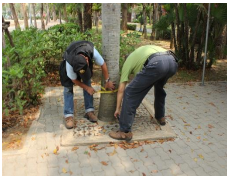
ภาพที่ ๗ ความโตเส้นรอบวง ๓๕ นิ้ว