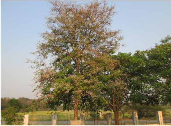
ภาพที่ ๕๓ ภูมิทัศน์รอบต้นเสลา สมบูรณ์ดี