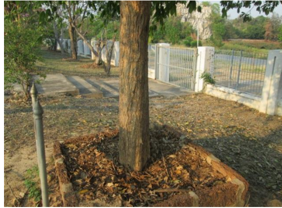
ภาพที่ ๕๔ สภาพบริเวณรอบต้นเสลา ทрудโทรม สมควรปรับปรุง