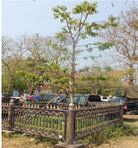
ภาพที่ ๘๒ ต้นเสลาต้นใหม่ที่นำมาปลูกทดแทน ด้านหน้าที่ว่าการ จังหวัดนครสวรรค์

องค์การบริหารส่วนจังหวัดนครสวรรค์ ได้นำต้นเสลาต้นใหม่มาปลูกทดแทน เนื่องจากต้นเสลาเดิมถูกพายพัดโค่นเสียหาย และได้นำป้ายเดิมออก