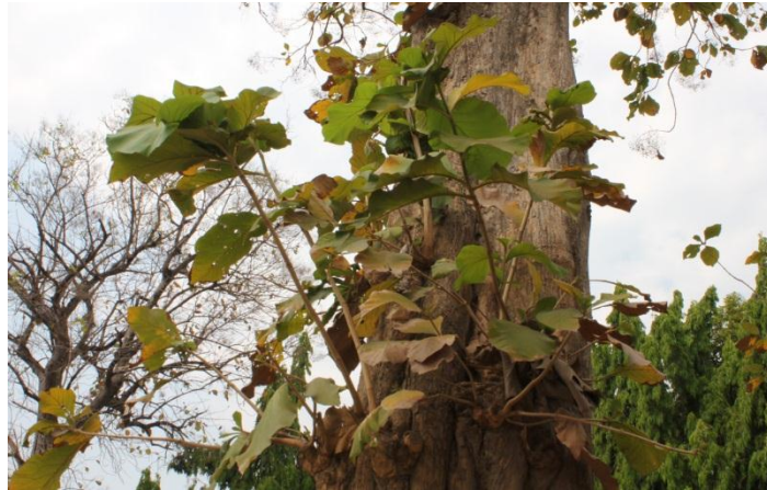
ภาพที่ ๓๒ ลักษณะใบของต้นสัก ไม่มีโรค/แมลง