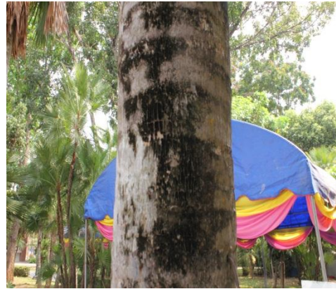
ภาพที่ ๑๕ ลำต้นมีเชื้อรา