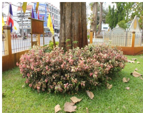
ภาพที่ ๒๗ ลำต้น ๑๓๐ นิ้ว มีปลวกขึ้น ที่เปลือกมีแมลงเจาะ มีกาฝาก