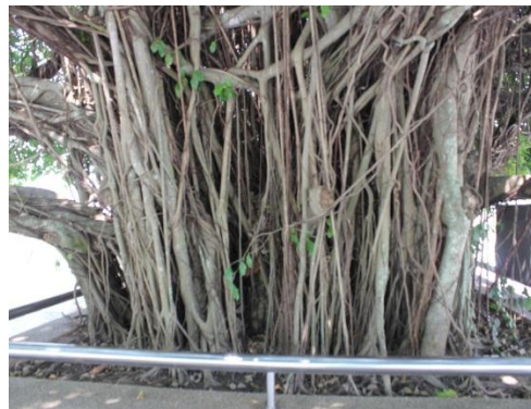
ภาพที่ ๙๐ ลำต้นมีเชื้อรา โคนต้นมีปลวก