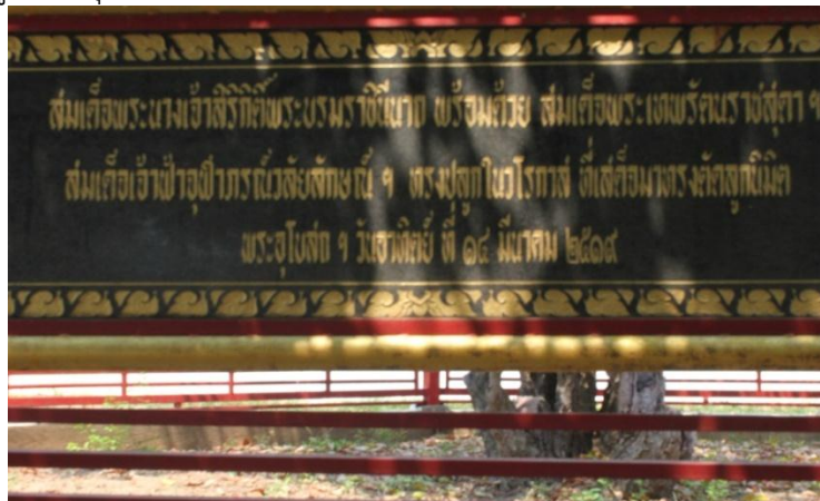
ภาพที่ ๖๙ ป้ายชื่อสมเด็จพระนางเจ้าสิริกิติ์ฯ พระบรมราชินีนาถ

สมเด็จพระนางเจ้าสิริกิติ์ฯ พระบรมราชินีนาถ พร้อมด้วย สมเด็จพระเทพรัตนราชสุดาฯ สยามบรมราชกุมารี ทรงร่วมปลูกต้นพิกุล เมื่อวันที่ ๑๔ มีนาคม ๒๕๑๙ วัดถือน้ำ อำเภอมือง จังหวัดนครสวรรค์