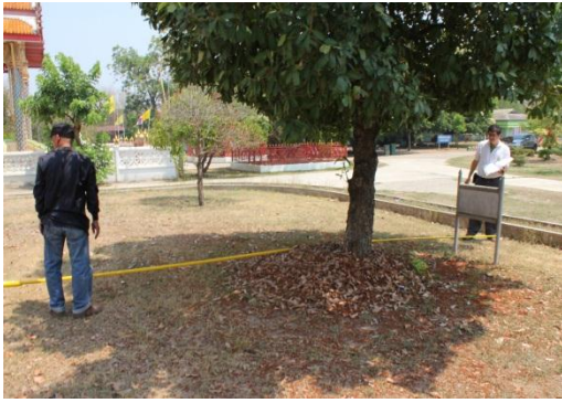
ภาพที่ ๘๐ ทรงพุ่ม ๗.๗ เมตร