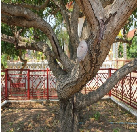
ภาพที่ ๖๘ ลำต้นมีปลวก เชื้อราและกาฝาก