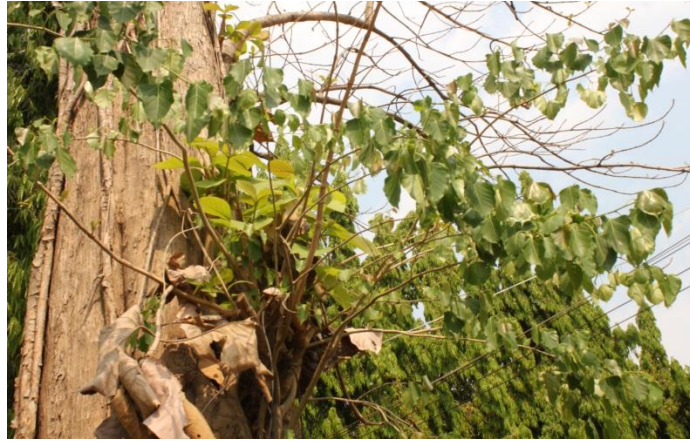
ภาพที่ ๓๖ ลักษณะใบของต้นสัก มีหนอนเจาะเปลือก มีกาฝาก