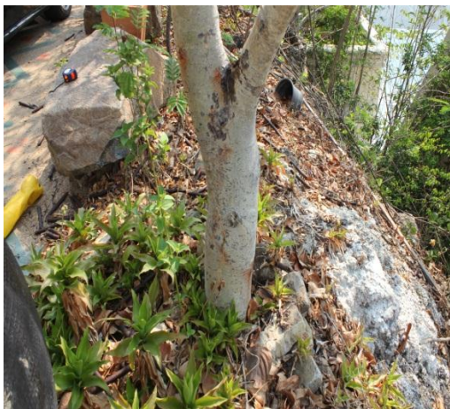
ภาพที่ ๕๙ ไม่มีป้ายชื่อ สมควรปรับปรุง