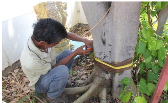
ภาพที่ ๖๓ ความโตลำต้น ๒ นาง ๖๕,๔๓ นิ้ว