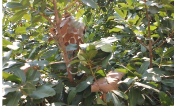
ภาพที่ ๘๑ ใบสารภี มีรังมด