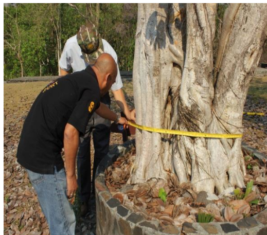
ภาพที่ ๙๙ ลำต้น ๘๗.๕ นิ้ว