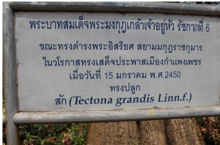
ภาพที่ ๒๙ ป้ายชื่อ รัชกาลที่ ๖ ทรงปลูก

พระบาทสมเด็จพระมงกุฎเกล้าเจ้าอยู่หัว รัชกาลที่ ๖ ทรงปลูกต้นสัก เมื่อวันที่ ๑๕ มกราคม ๒๔๕๐ บริเวณสำนักงานเหล่ากาชาด จังหวัดกำแพงเพชร