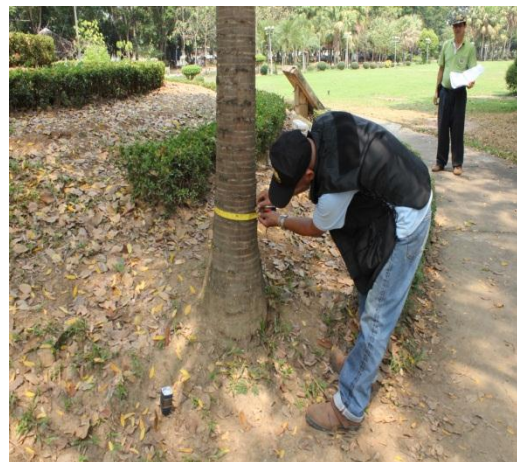
ภาพที่ ๒๒ ความโตลำต้นเส้นรอบวง ๒๙ นิ้ว