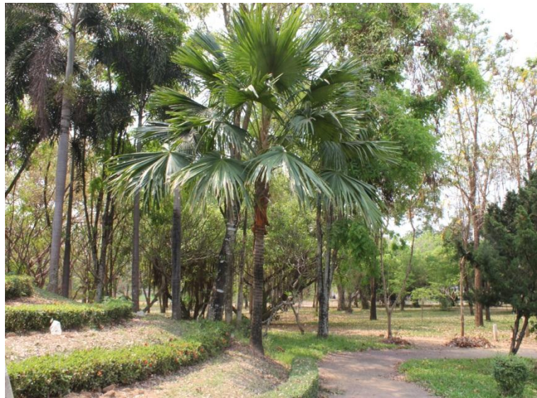
ภาพที่ ๑๖ ภูมิทัศน์รอบต้นค้อ สมบูรณ์ดี

สมเด็จพระเทพรัตนราชสุดาฯ สยามบรมราชกุมารี ทรงปลูกต้นค้อ เมื่อวันที่ ๓๑ พฤษภาคม ๒๕๔๕ เนื่องในวโรกาสทรงเปิดพระราชานุสาวรีย์ สมเด็จพระศรีนครินทราบรมราชชนนี บีงส์ไฟ อำเภอมือง จังหวัดพิจิตร