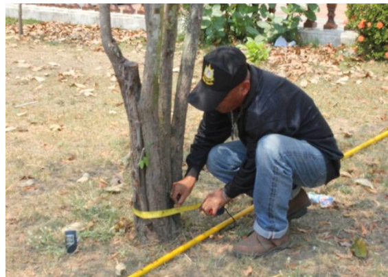
ภาพที่ ๗๕ ขนาดลำต้นเส้นรอบวง ๒๗ นิ้ว