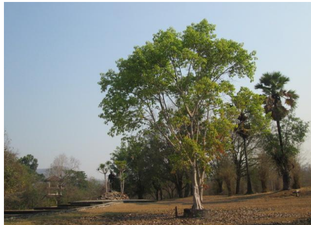
ภาพที่ ๙๘ ภูมิทัศน์รอบต้นไทรย้อยใบทู่ สมบูรณ์ดี