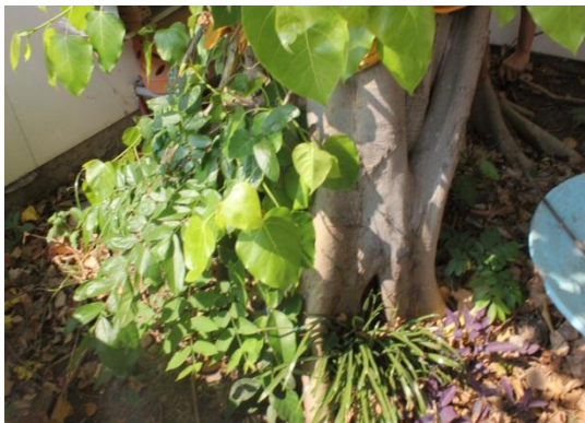
ภาพที่ ๖๒ ลำต้นมีกาฝาก