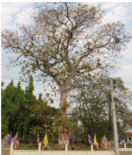
ภาพที่ ๓๐ ภูมิทัศน์รอบต้นสัก สมบูรณ์ดี