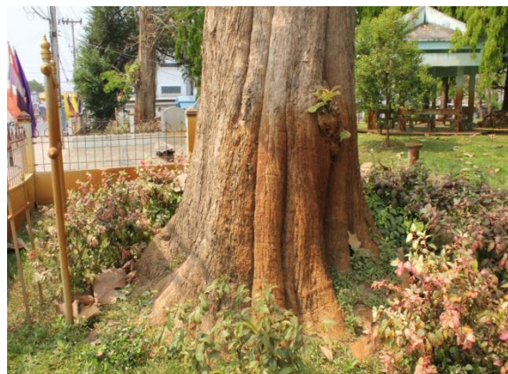
ภาพที่ ๓๑ ลำต้น ๑๖๙ นิ้ว มีกาฝาก