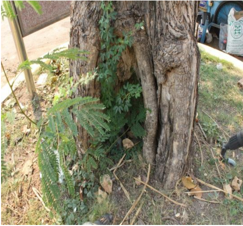
ภาพที่ ๔๔ มีปลวกและรา