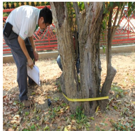
ภาพที่ ๗๑ ลำต้นเส้นรอบวง ๙๐ นิ้ว มีกาฝาก เชื้อรา