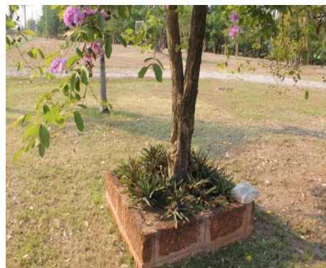
ภาพที่ ๔๘ ไม่มีป้ายชื่อ เห็นควรปรับปรุง