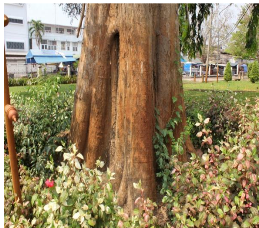
ภาพที่ ๓๕ ลำต้น ๑๘๖ นิ้ว มีปลวกที่เปลือกลำต้น