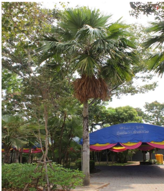
ภาพที่ ๖ ภูมิทัศน์รอบต้นค้อ สมบูรณ์ดี

สมเด็จพระพี่นางเธอ เจ้าฟ้ากัลยาณิวัฒนาฯ ทรงปลูกต้นค้อ เมื่อวันที่ ๔ มีนาคม ๒๕๓๐ เนื่องในวโรกาสเปิดสวนสมเด็จพระศรีนครินทร์ราชฯ บรมราชชนนี บีงส์ไฟ จังหวัดพิจิตร