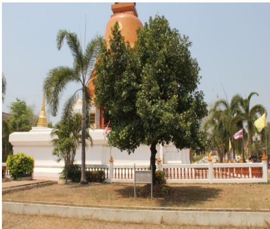
ภาพที่ ๗๘ ภูมิทัศน์รอบต้นสารภี สมบูรณ์ดี