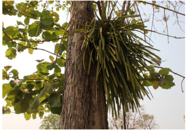
ภาพที่ ๔๕ มีกาฝาก