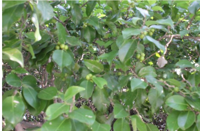
ภาพที่ ๙๑ ใบและผลของไทร โโรค/แมลง ไม่มี