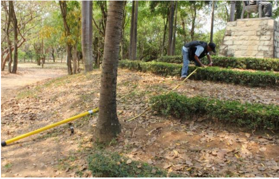
ภาพที่ ๒๓ ทรงพุ่ม ๖.๕ เมตร ๖. ต้นสัก