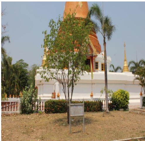
ภาพที่ ๗๔ ภูมิทัศน์รอบต้นลำดวน สมบูรณ์ดี