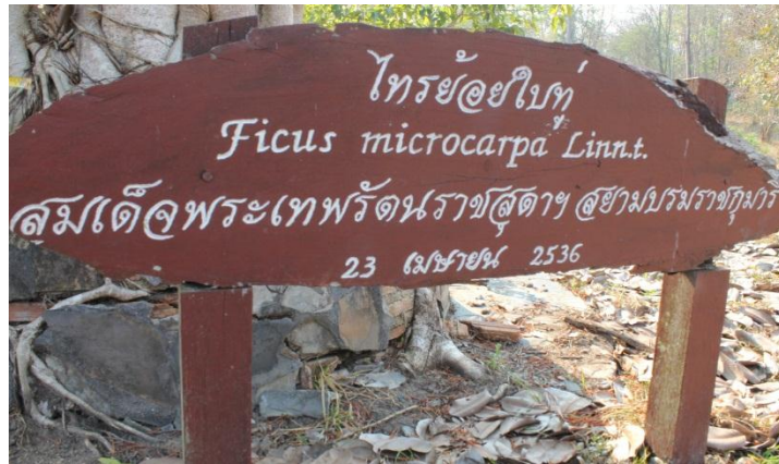
ภาพที่ ๙๗ ป้ายชื่อต้นไทรย้อยใบทู่