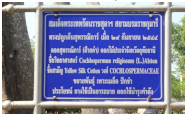
ภาพที่ ๙๒ ป้ายชื่อต้นสุพรรณนิการ์สมเด็จพระเทพรัตนราชสุดาฯ สยามบรมราชกุมารี ทรงปลูก

สมเด็จพระเทพรัตนราชสุดาฯ สยามบรมราชกุมารี ทรงปลูกต้นสุพรรณนิการ์ เมื่อ ๒๙ กันยายน ๒๕๔๔ ณ ศูนย์ศึกษาพิเศษตามอัยาศัย อำเภอเมือง จังหวัดอุทัยธานี