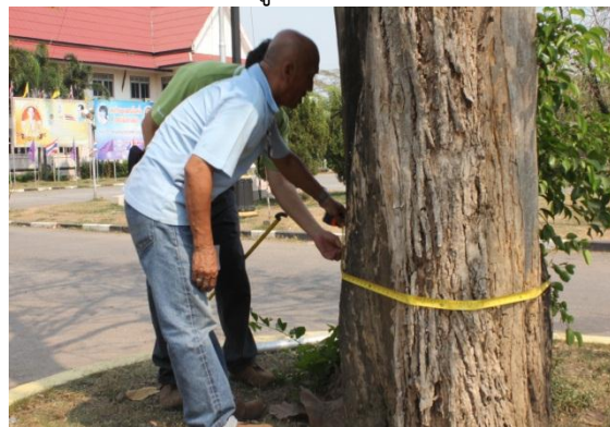
ภาพที่ ๓๙ ความโตลำต้นเส้นรอบวง ๑๑๓ นิ้ว