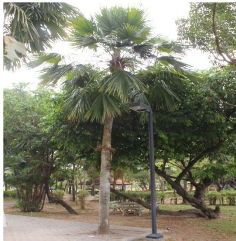
ภาพที่ ๑๑ ภูมิทัศน์รอบต้นค้อ สมบูรณ์ดี

สมเด็จพระเทพรัตนราชสุดาฯ สยามบรมราชกุมารี ทรงปลูกต้นค้อ เมื่อวันที่ ๓๑ พฤษภาคม ๒๕๔๕ เนื่องในวโรกาสทรงเปิดพระราชานุสาวรีย์ สมเด็จพระศรีนครินทราบรมราชชนนี บึงสีไฟ อำเภอเมือง จังหวัดพิจิตร