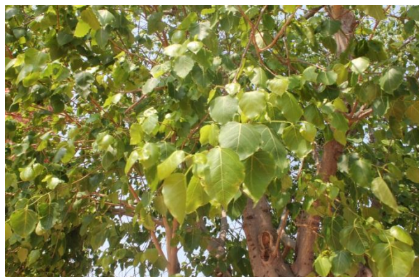
ภาพที่ ๖๔ ใบต้นโพธิ์ โรค/แมลง ไม่มี