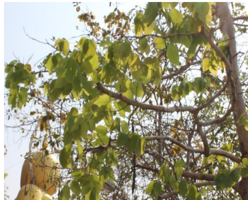
ภาพที่ ๖๐ ใบต้นราชพฤกษ์ ไม่มีโรค/แมลง