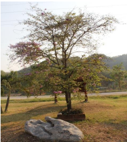
ภาพที่ ๔๗ ภูมิทัศน์รอบต้นเสลา