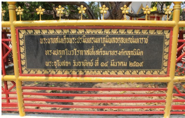
ภาพที่ ๖๖ ป้ายชื่อพระบาทสมเด็จพระเจ้าอยู่หัวฯ ทรงปลูกต้นพิกุล