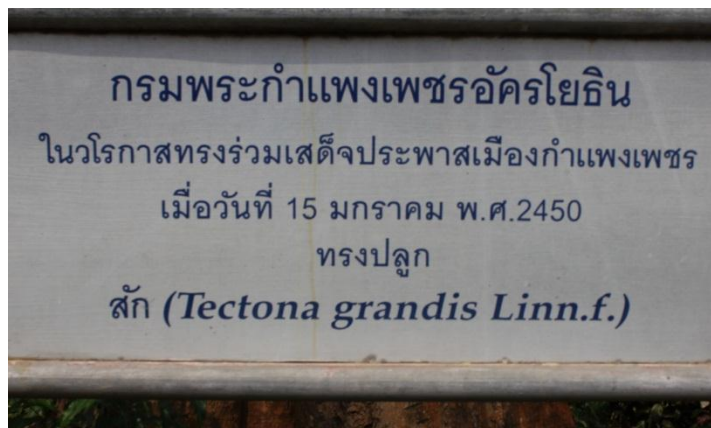
ภาพที่ ๓๓ ป้ายชื่อ กรมพระกำแพงเพชรอัครโยธิน ทรงปลูก

กรมพระกำแพงเพชรอัครโยธิน ทรงปลูกต้นสัก เมื่อวันที่ ๑๕ มกราคม ๒๔๕๐ บริเวณสำนักงานเหล่ากาชาด จังหวัดกำแพงเพชร