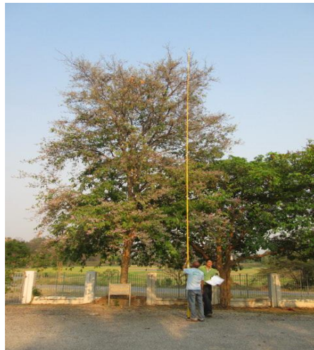
ภาพที่ ๕๖ ความสูง ๙.๔ เมตร