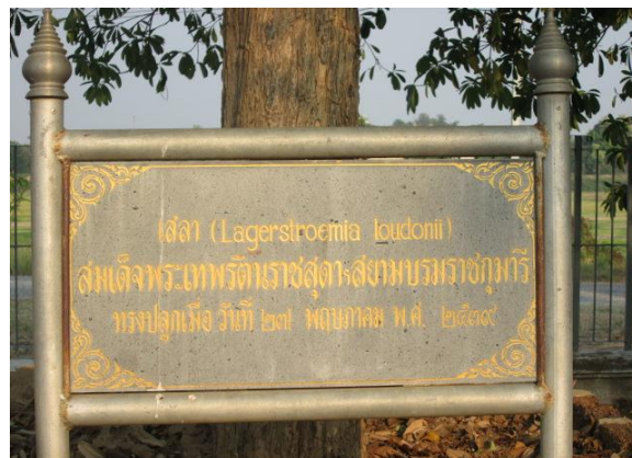
ภาพที่ ๕๒ ป้ายชื่อต้นเสลา