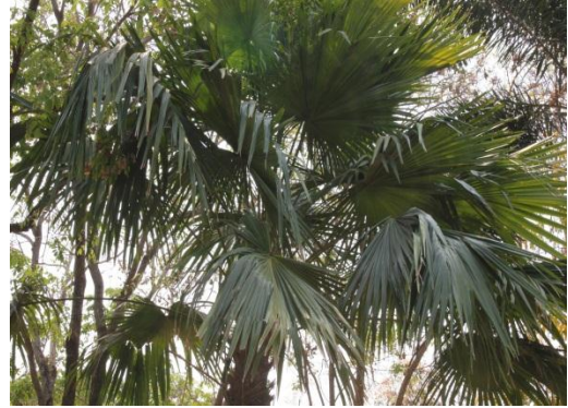
ภาพที่ ๒๔ ลักษณะใบต้นค้อ

พระยาวิเชียรปราการ (ฉาย อัมพเสวต) ปลูกต้นสักเมื่อวันที่ ๑๕ มกราคม ๒๔๕๐ ที่ระลึกต้นสักหน้าเมืองกำแพงเพชร อายุครบ ๑๐๑ ปี ด้านหน้าสำนักงานเหล่ากาชาด จังหวัดกำแพงเพชร