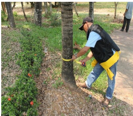
ภาพที่ ๑๗ ความโตลำต้น ๒๗ นิ้ว