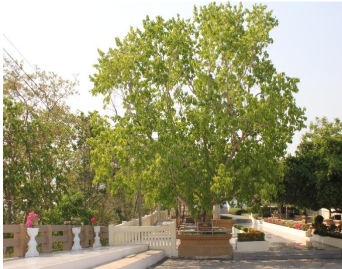
ภาพที่ ๘๕ ภูมิทัศน์รอบต้นโพธิ์ สมบูรณ์ดี