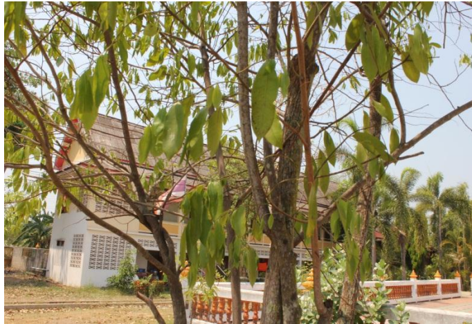
ภาพที่ ๗๖ ใบของต้นลำตวน โรค/แมลง ไม่มี