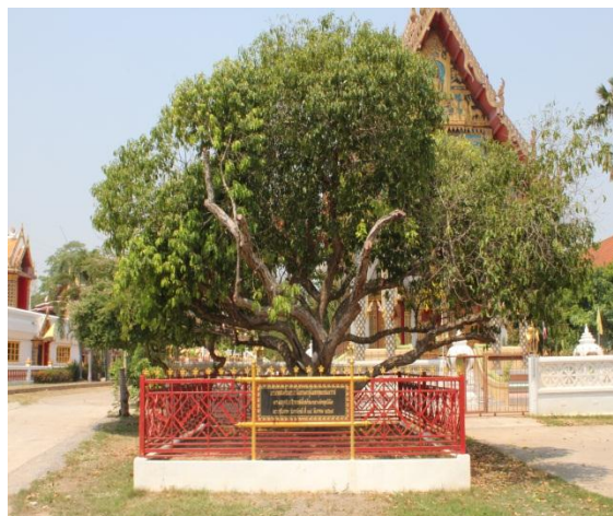
ภาพที่ ๖๗ ภูมิทัศน์รอบต้นพิกุล สมบูรณ์ดี