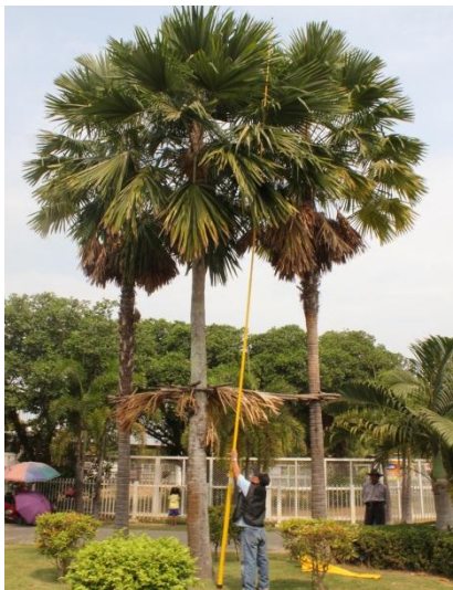
ภาพที่ ๔ ความสูง ๙.๕ เมตร