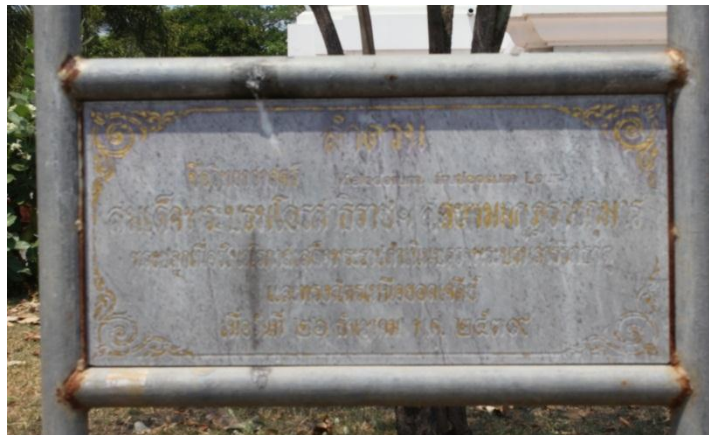
ภาพที่ ๗๓ ป้ายชื่อสมเด็จพระบรมโอรสาธิราชฯ สยามมกุฎราชกุมาร ทรงปลูกต้นลำดวน

สมเด็จพระบรมโอรสาธิราชฯ สยามมกุฎราชกุมาร ทรงปลูกต้นลำดวน เมื่อวันที่ ๒๖ ธันวาคม ๒๕๓๙ เนื่องในวโรกาสเสด็จพระราชดำเนินบรรจुพระบรมสารีริกธาตุ วัดถือน้ำ อำเภอมือง จังหวัดนครสวรรค์