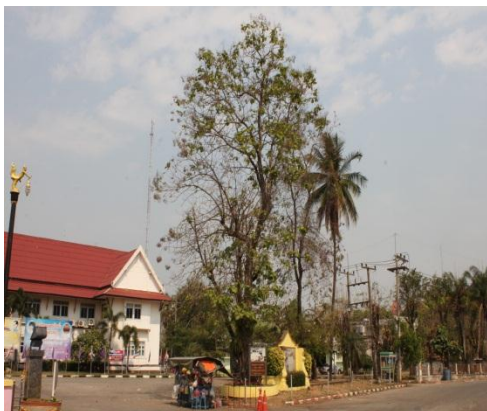
ภาพที่ ๔๒ ภูมิทัศน์รอบต้นสัก สมบูรณ์ดี