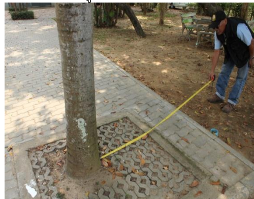
ภาพที่ ๑๓ ทรงพุ่ม ๓.๘ เมตร