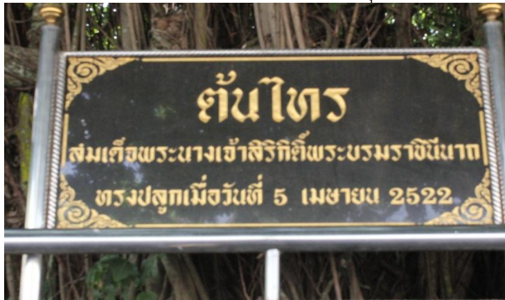
ภาพที่ ๘๘ ป้ายชื่อต้นไทรสมเด็จพระนางเจ้าสิริกิติ์ฯ พระบรมราชินีนาถ ทรงปลูก

สมเด็จพระนางเจ้าสิริกิติ์ฯ พระบรมราชินีนาถ ทรงปลูกต้นไทร เมื่อวันที่ ๕ เมษายน ๒๕๒๒ ณ เขาสะแกกรัง อำเภอเมือง จังหวัดอุทัยธานี