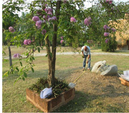
ภาพที่ ๕๐ ทรงพุ่ม ๕.๒ เมตร