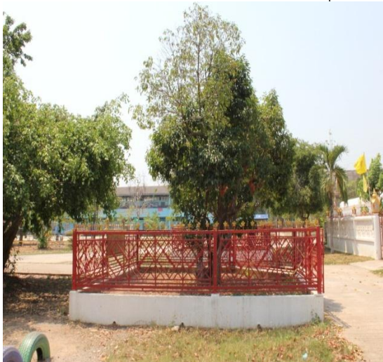
ภาพที่ ๗๐ กุ้มที่ศรัทธาต้นพิกุล สมบูรณดี

พร้อมด้วย สมเด็จพระเทพรัตนราชสุดาฯ สมเด็จพระเจ้าฟ้าจุฬาภรณวลัยลักษณ์ฯ ทรงร่วมปลูกต้นพิกุล