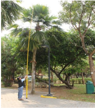
ภาพที่ ๑๔ ความสูง ๘.๘ เมตร