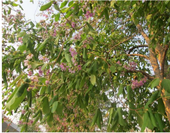
ภาพที่ ๕๕ ดอกเสลา ไม่มีโรค/แมลง