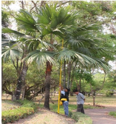
ภาพที่ ๑๙ ความสูง ๖.๕ เมตร