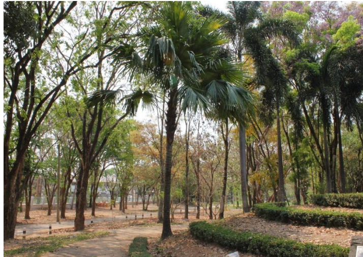
ภาพที่ ๒๐ ภูมิทัศน์รอบต้นค้อ สมบูรณ์ดี

สมเด็จพระเทพรัตนราชสุดาฯ สยามบรมราชกุมารี ทรงปลูกต้นค้อ เมื่อวันที่ ๓๑ พฤษภาคม ๒๕๔๕ เนื่องในวโรกาสทรงเปิดพระราชานุสาวรีย์ สมเด็จพระศรีนครินทราบรมราชชนนี บึงสีไฟ อำเภอเมือง จังหวัดพิจิตร