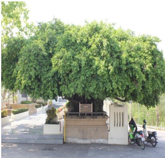
ภาพที่ ๘๙ ภูมิทัศน์รอบต้นไทร สมบูรณ์ดี