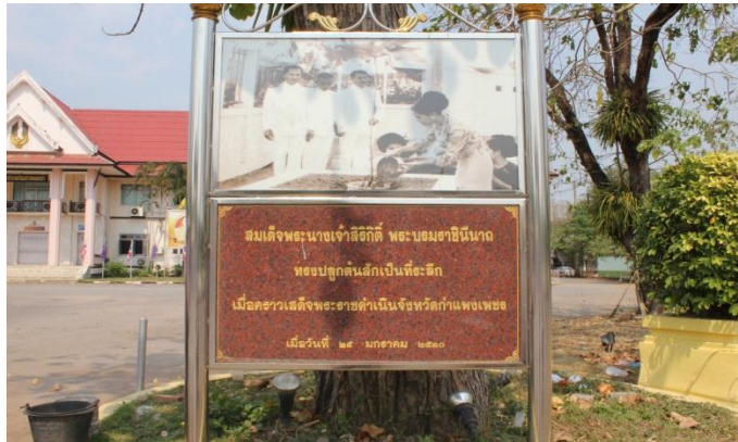
ภาพที่ ๔๑ ป้ายชื่อสมเด็จพระนางเจ้าฯ พระบรมราชินีนาถ ขณะทรงปลูก

สมเด็จพระนางเจ้าสิริกิติ์ พระบรมราชินีนาถ ทรงปลูกต้นสักเป็นที่ระลึก เมื่อคราวเสด็จพระราชดำเนิน จังหวัดกำแพงเพชร เมื่อวันที่ ๒๕ มกราคม ๒๕๑๐ ด้านหน้าอำเภอเมือง จังหวัดกำแพงเพชร