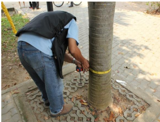
ภาพที่ ๑๒ ความโตลำต้นเส้นรอบวง ๓๒ นิ้ว