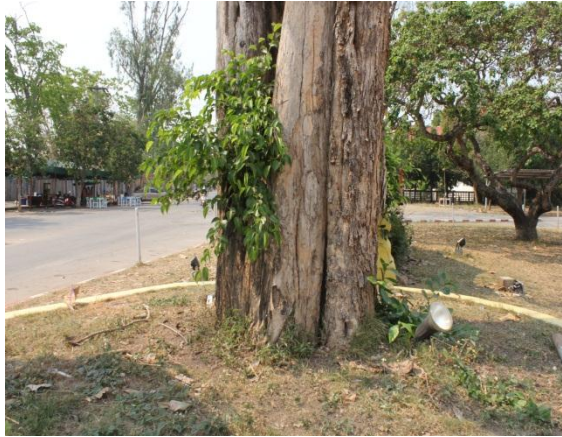
ภาพที่ ๔๐ โคนต้นไม้โพรง เปลือกแห้งแตก