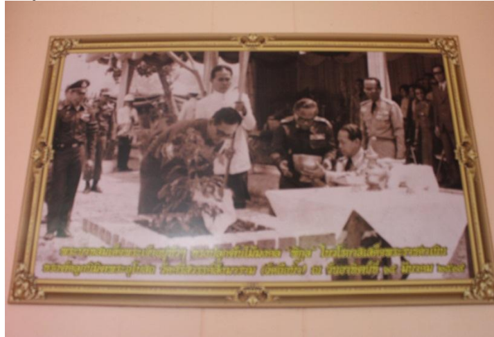
ภาพที่ ๖๕ ภาพถ่ายขณะทรงปลูก

พระบาทสมเด็จพระเจ้าอยู่หัวฯ ทรงปลูกต้นพิกุล เมื่อวันที่ ๑๔ มีนาคม ๒๕๑๙ เนื่องในวโรกาสที่เสด็จมาตัดลูกนิมิตพระอุโบสถ วัดถือน้ำ อำเภอมือง จังหวัดนครสวรรค์