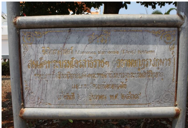
ภาพที่ ๗๗ สมเด็จพระบรมโอรสาธิราชฯ สยามมกุฎราชกุมาร ทรงปลูกต้นสารภี