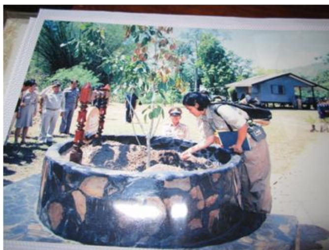
ภาพที่ ๙๖ ภาพถ่ายขณะทรงปลูก

๒๓. ต้นไทรย้อยใบทู่ สมเด็จพระเทพรัตนราชสุดาฯ สยามบรมราชกุมารี ทรงปลูกต้นไทรย้อยใบทู่ เมื่อวันที่ ๒๓ เมษายน ๒๕๓๖ ทรงเปิดอนุสรณ์สถานสี่บ นาคะเสถียร เขตรักษาพันธุ์สัตว์ป่าห้วยขาแข้ง จังหวัดอุทัยธานี