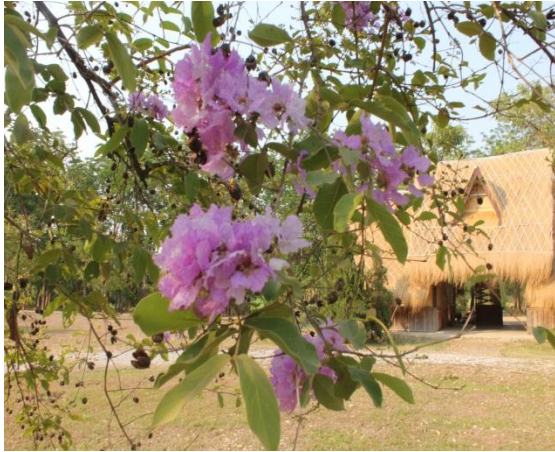
ภาพที่ ๔๙ ลักษณะใบต้นเสลา โครค/แมลงไม่มี