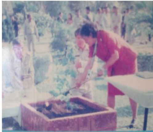
ภาพที่ ๔๖ ภาพถ่ายขณะทรงปลูก

สมเด็จพระเทพรัตนราชสุดาฯ สยามบรมราชกุมารี ทรงปลูกต้นเสลา ณ โครงการพัฒนาและปรับปรุงพื้นที่ดิน มูลนิธิชัยพัฒนา อันเนื่องมาจากพระราชดำริ วัดศรีอุทุมพร อำเภอเมือง จังหวัดนครสวรรค์