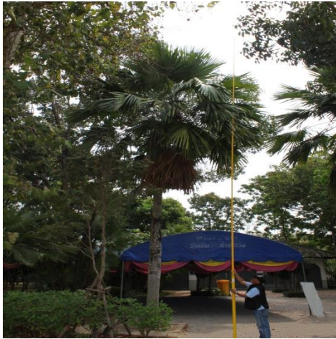
ภาพที่ ๙ ความสูง ๙.๔ เมตร