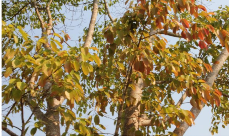
ภาพที่ ๑๐๐ ลักษณะใบไทรย้อยใบทู่ โรค/แมลง ไม่มี