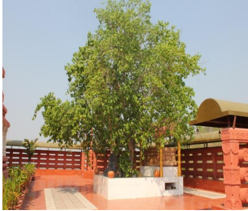
ภาพที่ ๖๑ ภูมิทัศน์รอบต้นโพธิ์ สมบูรณ์ดี

สมเด็จพระเทพรัตนราชสุดาฯ สยามบรมราชกุมารี ทรงปลูกต้นโพธิ์ เมื่อวันที่ ๑ ตุลาคม ๒๕๔๘ ณ วัดป่าสิริวัฒนวิสุทธิ์ ในพระองค์ฯ ตำบลท่าบ่อ อำเภอบ้านไร่ จังหวัดนครสวรรค์