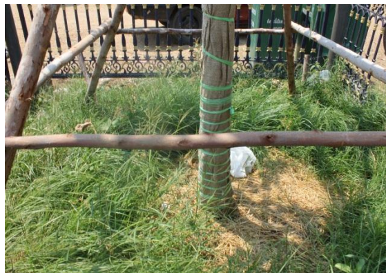
ภาพที่ ๘๓ ลำต้นเส้นรอบวง ๑๕ นิ้ว ความสูง ๖.๕ เมตร ทรงพุ่ม ๒.๓๐ เมตร