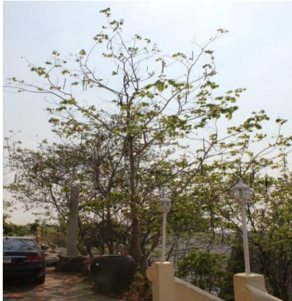
ภาพที่ ๕๗ ภูมิทัศน์รอบต้นราชพฤกษ์

ทุลกระหม่อมหญิงอุบลรัตนราชกัญญาฯ ทรงปลูกต้นราชพฤกษ์ เมื่อวันที่ ๒ กันยายน ๒๕๔๗ ณ วัดป่าสิริวัฒนวิสุทธิ์ ในพระองค์ฯ ตำบลทำนบ อำเภอนาทะโก จังหวัดนครสวรรค์