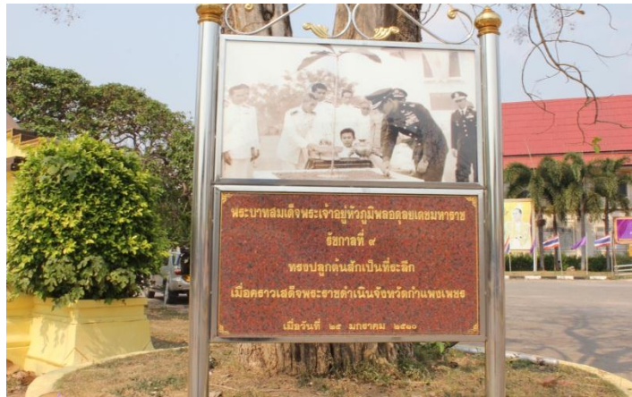
ภาพที่ ๓๗ ป้ายชื่อ ขณะทรงปลูก

พระบาทสมเด็จพระเจ้าอยู่หัวฯ ทรงปลูกต้นสักเป็นที่ระลึก เมื่อคราวเสด็จพระราชดำเนิน จังหวัดกำแพงเพชร วันที่ ๒๕ มกราคม ๒๕๑๐ ด้านหน้าอำเภอเมือง จังหวัดกำแพงเพชร