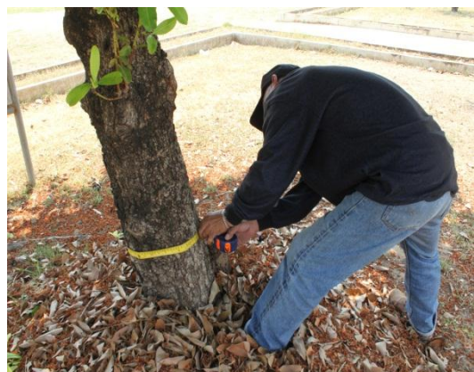
ภาพที่ ๗๙ ลำต้น ๓๕ นิ้ว มีปลวกโคนต้น มีเชื้อราตามกิ่ง