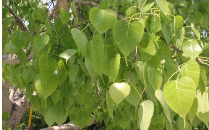
ภาพที่ ๘๗ ใบต้นโพธิ์ โรค/แมลงไม่มี