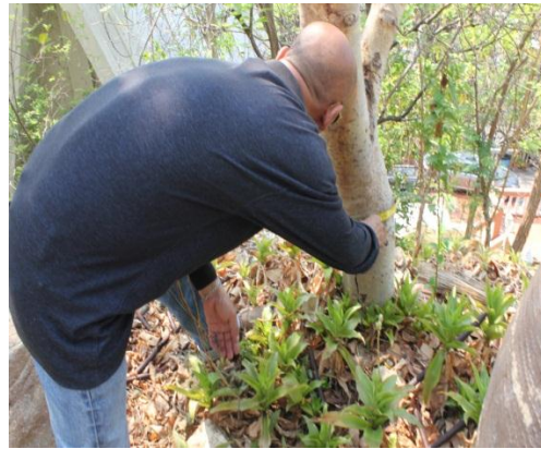
ภาพที่ ๕๘ ลำต้น ๒๒ นิ้ว