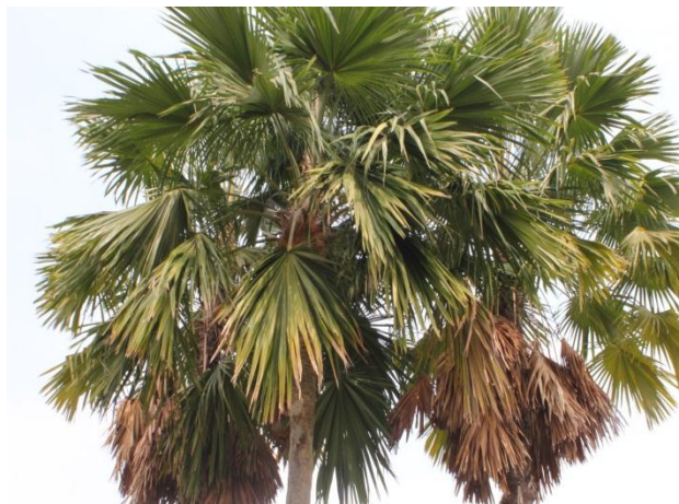
ภาพที่ ๓ ลักษณะใบต้นค้อ