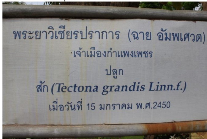
ภาพที่ ๒๕ ป้ายชื่อ พระยาวิเชียรปราการ (ฉาย อัมพเสวต)

พระยาวิเชียรปราการ (ฉาย อัมพเสวต) ปลูกต้นสักเมื่อวันที่ ๑๕ มกราคม ๒๔๕๐ ที่ระลึกต้นสักหน้าเมืองกำแพงเพชร อายุครบ ๑๐๑ ปี ด้านหน้าสำนักงานเหล่ากาชาด จังหวัดกำแพงเพชร