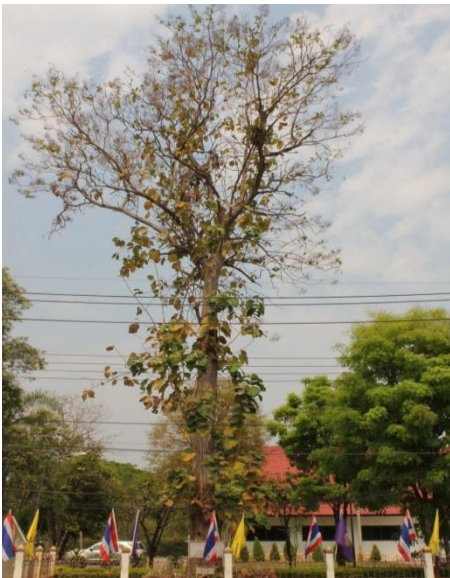
ภาพที่ ๒๖ ภูมิทัศน์รอบต้นสัก สมบูรณ์ดี