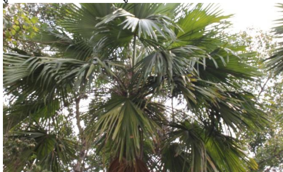
ภาพที่ ๘ ลักษณะใบต้นค้อ