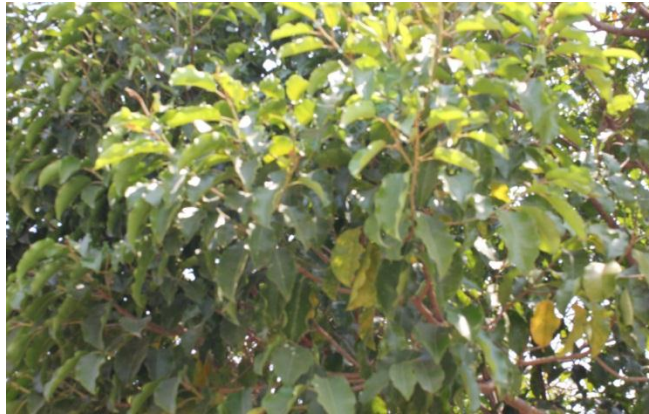
ภาพที่ ๗๒ ลักษณะใบของฟิกุล ไม่มีแมลง