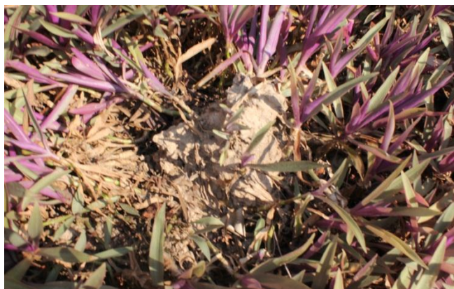
ภาพที่ ๙๕ มีปลวกขึ้นรอบโคนต้นสุพรรณนิการ์

๒๓. ต้นไทรย้อยใบทู่ สมเด็จพระเทพรัตนราชสุดาฯ สยามบรมราชกุมารี ทรงปลูกต้นไทรย้อยใบทู่ เมื่อวันที่ ๒๓ เมษายน ๒๕๓๖ ทรงเปิดอนุสรณ์สถานสี่บ นาคะเสถียร เขตรักษาพันธุ์สัตว์ป่าห้วยขาแข้ง จังหวัดอุทัยธานี