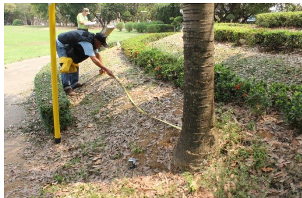
ภาพที่ ๑๘ ทรงพุ่ม ๕.๔ เมตร