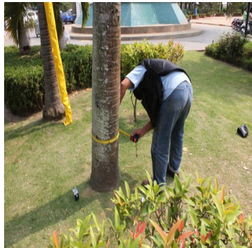
ภาพที่ ๒ ความโตลำต้นเส้นรอบวง ๓๖ นิ้ว