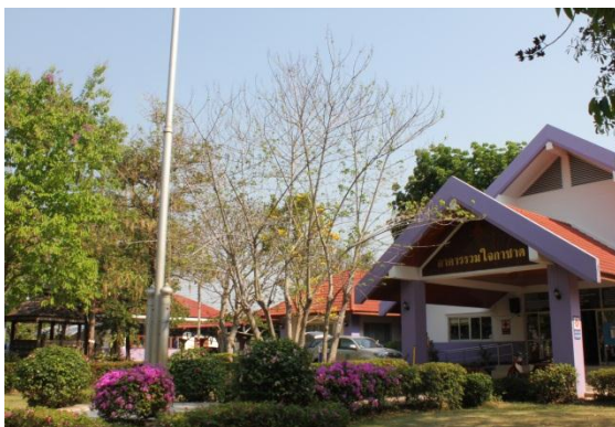
ภาพที่ ๙๓ ภูมิทัศน์รอบต้นสุพรรณนิการ์ สมบูรณ์ดี