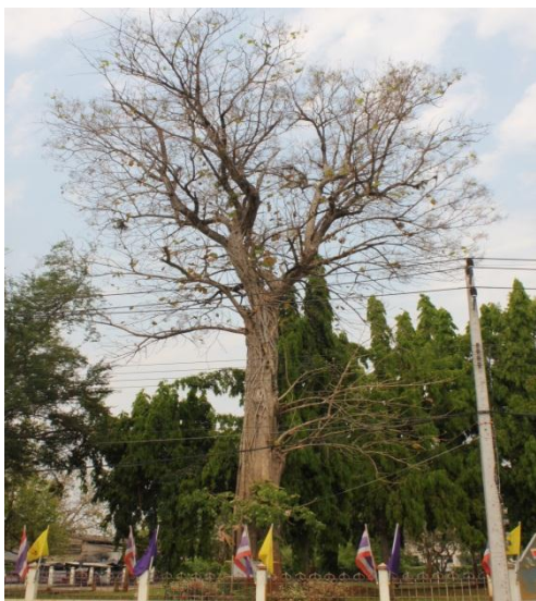
ภาพที่ ๓๔ ภูมิทัศน์รอบต้นสัก สมบูรณ์ดี