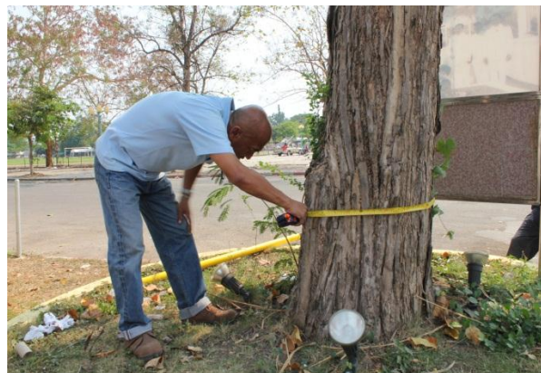
ภาพที่ ๔๓ ความโตลำต้นเส้นรอบวง ๘๘ นิ้ว