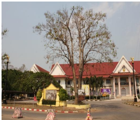
ภาพที่ ๓๘ ภูมิทัศน์รอบต้นสัก ไม่สมบูรณ์