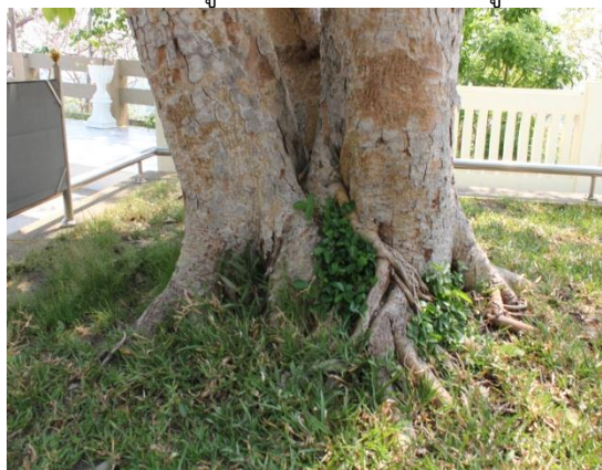
ภาพที่ ๘๖ ลำต้นเส้นรอบวง ๑๐๕ นิ้ว มีเชื้อราเล็กน้อย