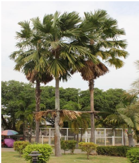
ภาพที่ ๑ ภูมิทัศน์รอบต้นค้อ สมบูรณ์ดี

สมเด็จพระเทพรัตนราชสุดาฯ สยามบรมราชกุมารี ทรงปลูกต้นค้อ เมื่อวันที่ ๓๑ พฤษภาคม ๒๕๔๕ เนื่องในวโรกาสทรงเปิดพระราชานุสาวรีย์ สมเด็จพระศรีนครินทราบรมราชชนนี บึงสีไฟ อำเภอเมือง จังหวัดพิจิตร