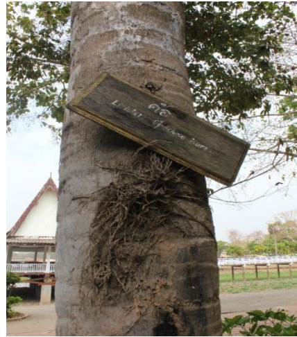
ภาพที่ ๑๐ ลำต้นมีหนอน เชื้อรา