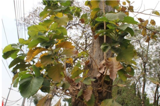
ภาพที่ ๒๘ ลักษณะใบต้นสัก ไม่มีโรค