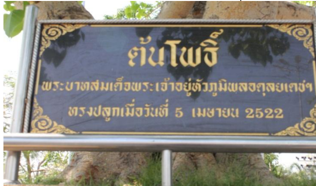
ภาพที่ ๘๔ ป้ายชื่อต้นโพธิ์พระบาทสมเด็จพระเจ้าอยู่หัวฯ ทรงปลูก

พระบาทสมเด็จพระเจ้าอยู่หัวฯ ทรงปลูกต้นโพธิ์ เมื่อวันที่ ๕ เมษายน ๒๕๒๒ ณ เขาสะแกกรัง อำเภอเมือง จังหวัดอุทัยธานี