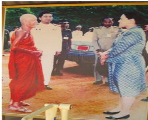
ภาพที่ ๕๑ ภาพถ่ายขณะเสด็จ ณ วัดศรีอุทุมพร

สมเด็จพระเทพรัตนราชสุดาฯ สยามบรมราชกุมารี ทรงปลูกต้นเสลา เมื่อวันที่ ๒๗ พฤษภาคม ๒๕๓๙